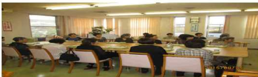
(保護者有志の皆様)