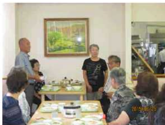
(保護者会長ご挨拶)