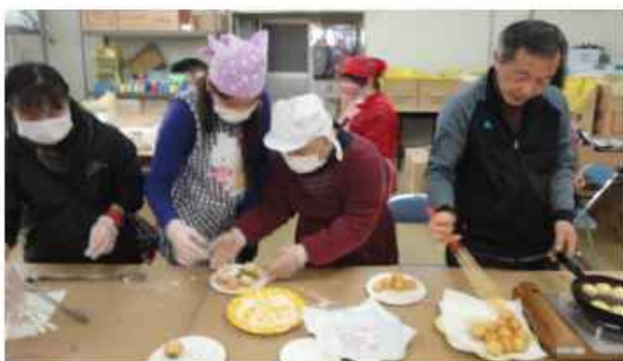
利用者の皆さんと支援員が一緒になってのドーナツ作り

今月はまだ寒いので・・・苑外はダメだなあ・・・。今回は利用者の皆さんと調理実習でドーナツを作ることになりました。(笑)