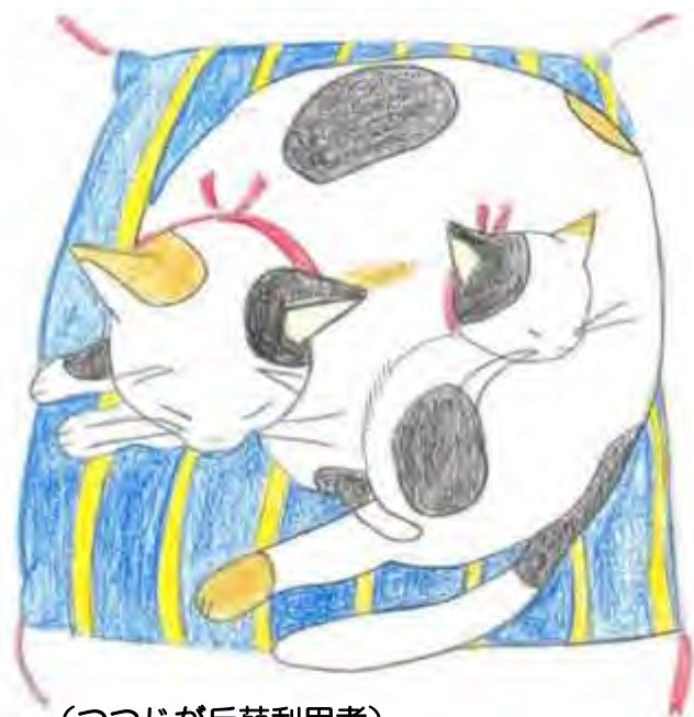
(つつじが丘苑利用者)